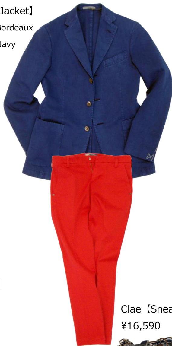
Entre amis 【Pants】