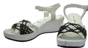
Pons Quintana 【Sandal】