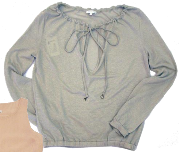
Patrizia Pepe 【Tops】