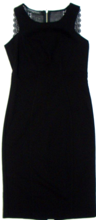
Sandro Ferrone 【Onepiece】 ¥25,200