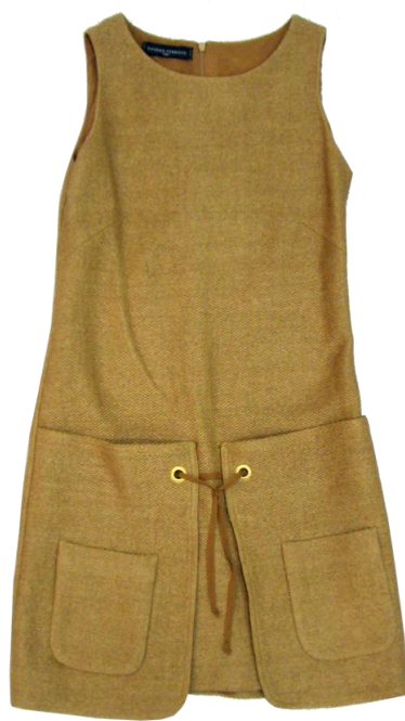
Sandro Ferrone 【Onepiece】 ¥27,300