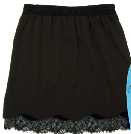
Patrizia Pepe [Skirt]