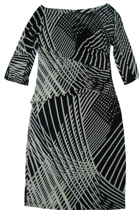
Sandro Ferrone 【Onepiece】 ¥23,100