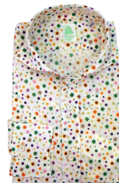
Fina more 【Shirts】