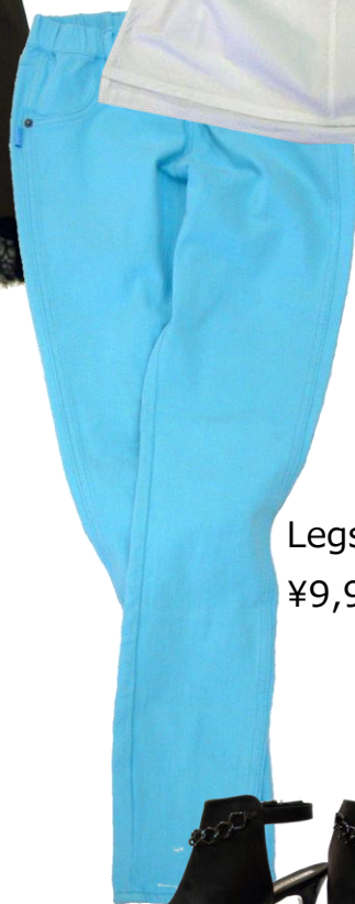
Legs [Leggings Pants]