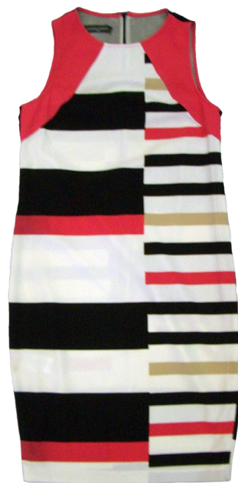
Sandro Ferrone 【Onepiece】 ¥23,100