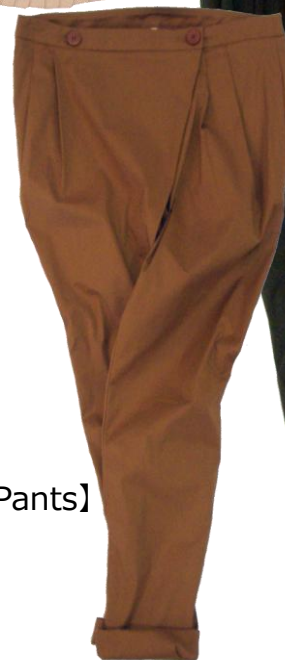
Patrizia Pepe 【Pants】