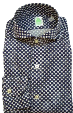
Fina more 【Shirts】