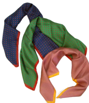
AD56 MILANO 【Scarf】