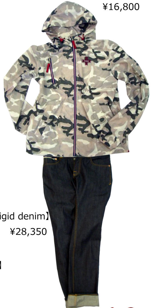
Care Label 【Rigid denim】