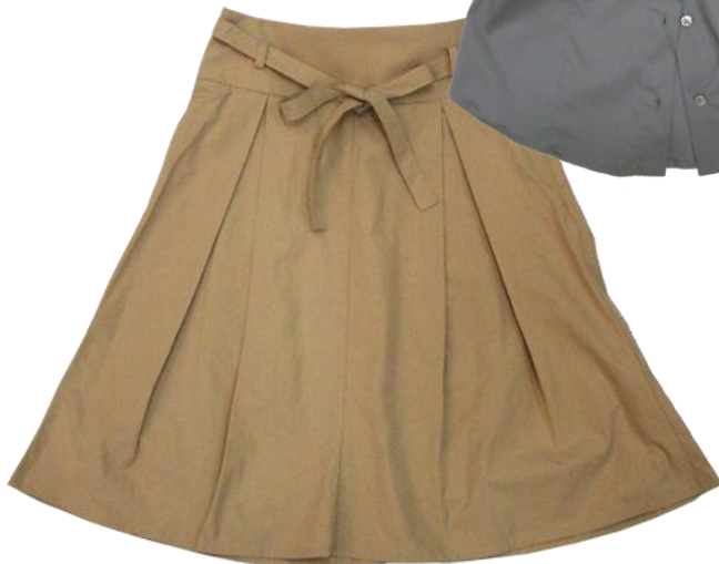
Patrizia Pepe 【Skirt】