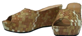
Pons Quintana 【Sandal】