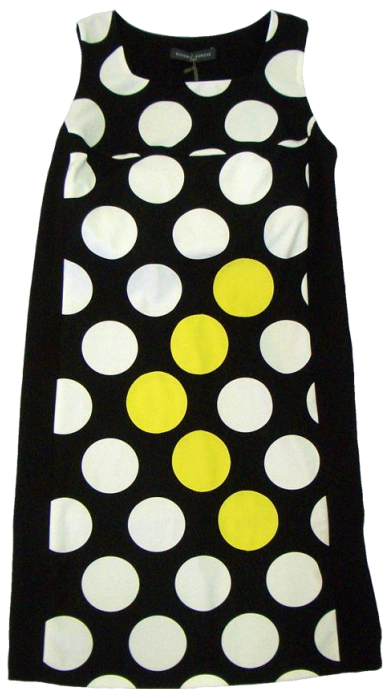
Sandro Ferrone 【Onepiece】 ¥19,950