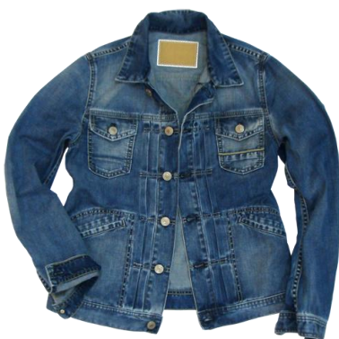
Care Label 【G-Jam】