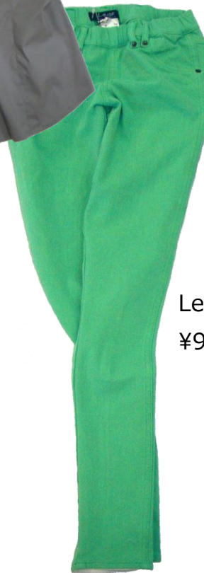
Legs 【Leggings Pants】