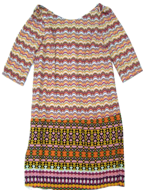
Sandro Ferrone 【Onepiece】 ¥24,150